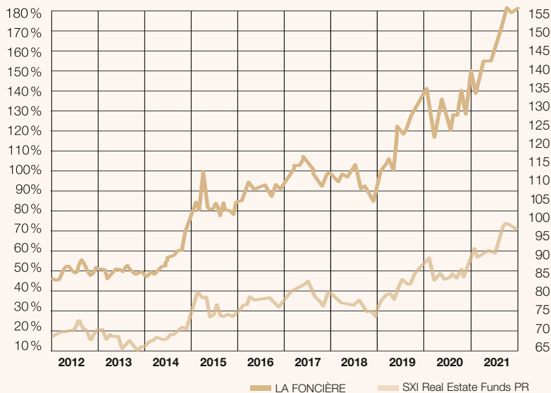
Börsenkursentwicklung vom 01.01.2012 bis 30.09.2021